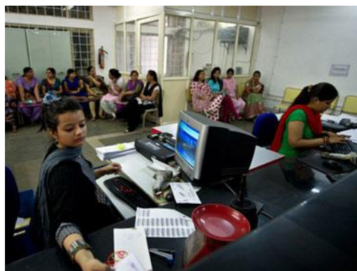
तलिका : भारत में प्रमुख लघु उद्योग क्षेत्रक में महिलाओं की भागीदारी

केरल में, 20% उद्यम तमिलनाडु में तथा 9.69% कर्नाटक में हैं इस सर्वेक्षण से यह तथ्य स्पष्ट हो जाता है कि महिला साक्षरता तथा महिला उद्यमिता के बीच प्रत्यक्ष संबंध हैं, केरल में भात-प्रति त महिलाएं साक्षर हैं केरल राज्य सरकार ने महिलाओं के लिए व्यावसायिक शिक्षा के अनेक पाठ्यक्रम प्रारम्भ किए हैं परिणाम सामने हैं।